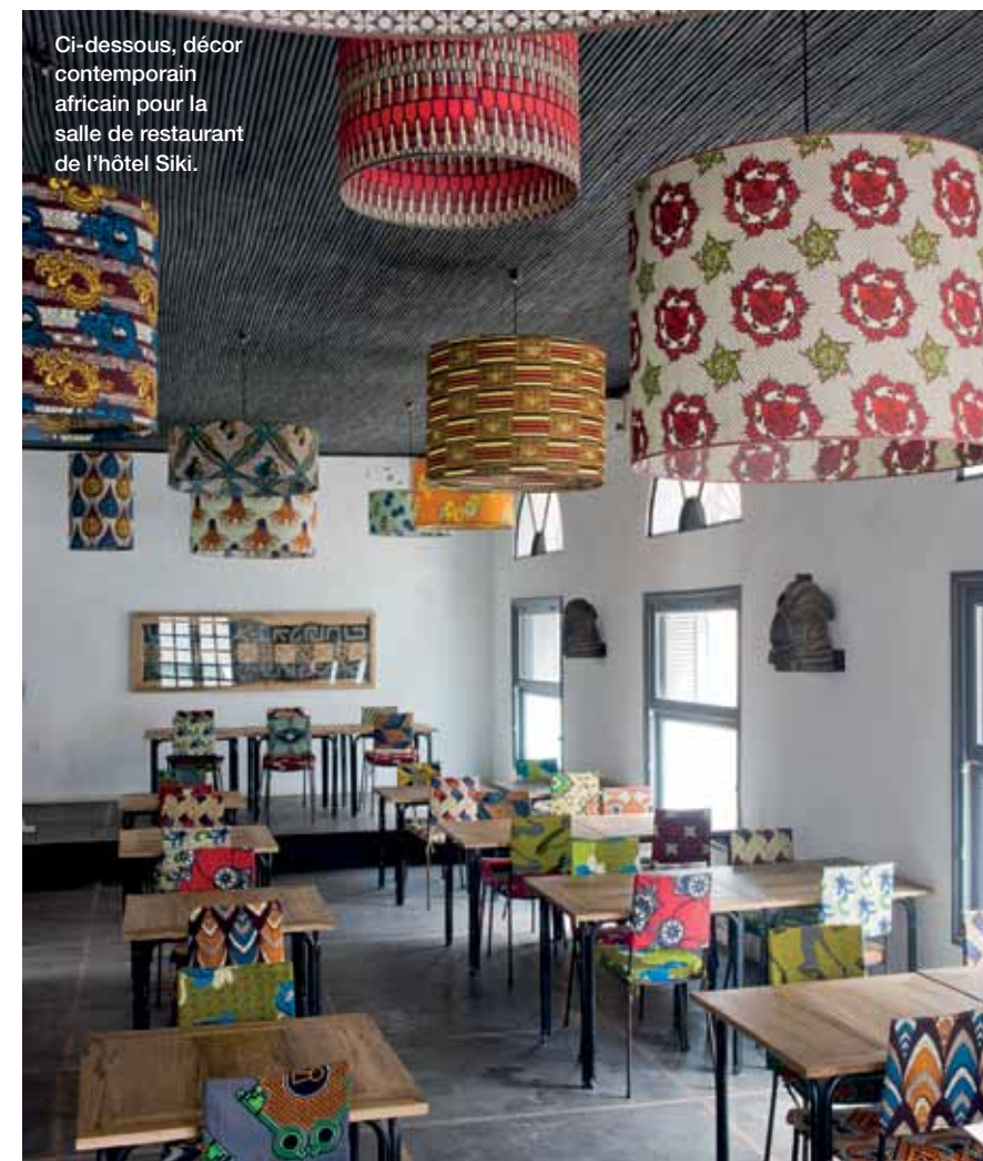
Ci-dessous, décor contemporain africain pour la salle de restaurant de l'hôtel Siki.