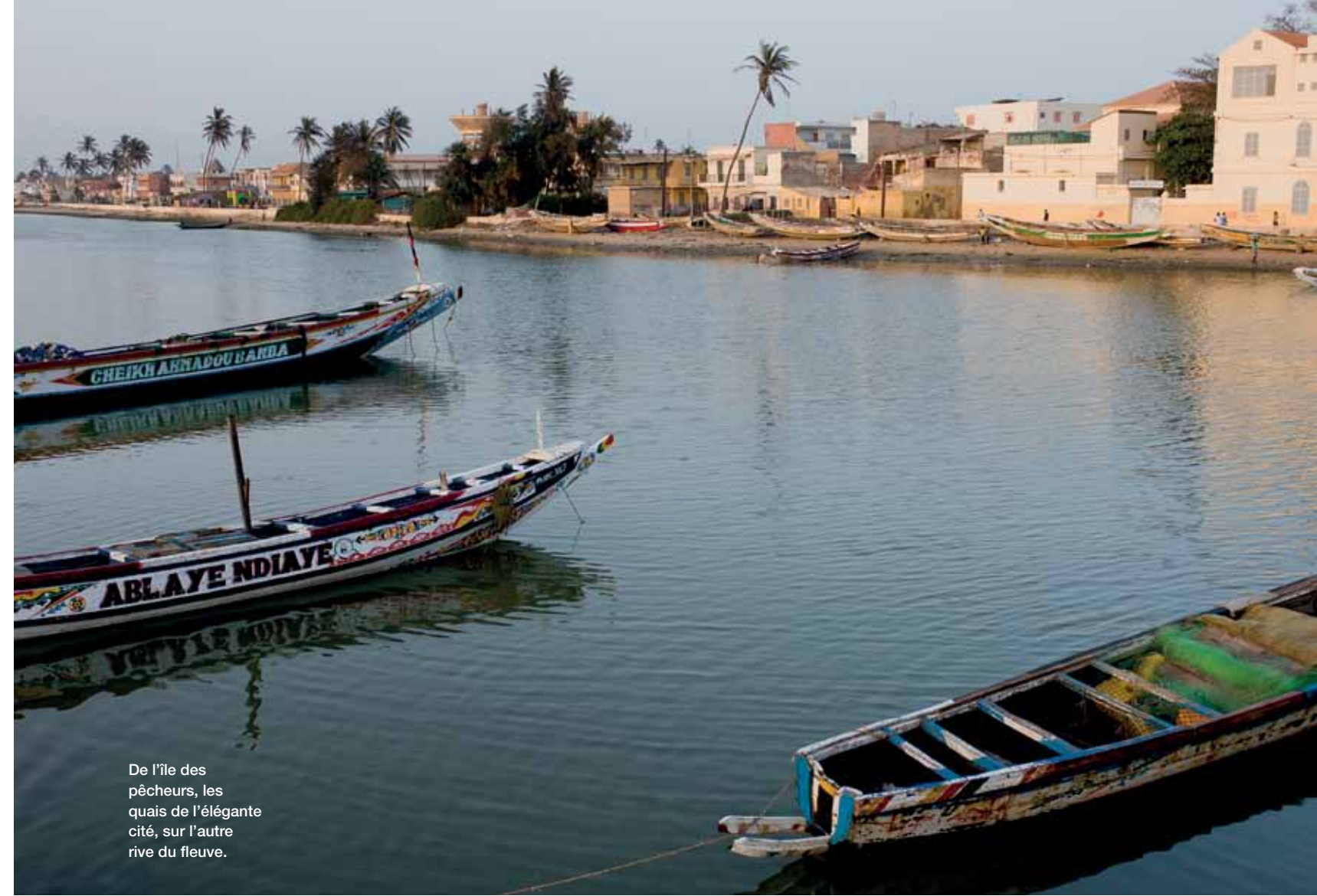
De l'île des pêcheurs, les quais de l'élégante cité, sur l'autre rive du fleuve.