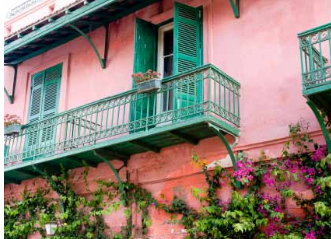
Les rues de Saint-Louis affichent leurs magnifiques façades. Ci-dessus, celle de la Maison Rose est envahie d'hibiscus en fleurs. Ci-dessous, la circulation est dense et animée sur le pont Faidherbe.

a utrefois nouveau monde, Saint-Louis restitue aujourd'hui les fruits de son étrange amitié avec l'Europe. Son paysage presque familier a gardé ses couleurs et ses formes méditerranéennes mais s'agit à l'africaine avec grâce et vitalité. Ancienne capitale de l'Afrique de l'Ouest francophone, ce port concentre un patrimoine architectural, historique et culturel remarquable, inscrit au Patrimoine mondial de l'Humanité depuis 2000. Les belles demeures coloniales à étages ou de plain-pied sont construites autour de cours ou de patios ombragés de fleurs et de palmiers. Leurs balcons en feronnerie ou en bois animent de jeux d'ombres dentelées les plus jolies façades. De l'ocre jaune au rouge le plus intense, l'atmosphère si bien décrite par Pierre Loti est picturale et poétique. Un bonheur pour les chasseurs d'images.